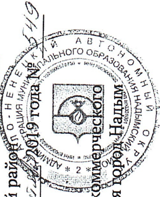
Схема расположения элементов улично-дорожной сети территории садоводческого некоммерческого товарищества «Сады Ямала», расположенного в границах муниципального образования город Надым